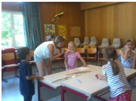
Schnuppern im Juli 2019

Am Donnerstag, 12.9.19, wird der AG-Brief für die Grundschule ausgeteilt. Unter anderem freuen wir uns darüber, dass wir wieder eine neue Bläserklassen-AG in Kooperation mit dem Musikverein Ochsenbach anbieten können. Die AGs starten in der Regel ab dem 23.9.19. Der Mittagstisch geht am 23.9.19 los. Den Speiseplan finden Sie bereits auf der HP. Der Nachmittagsunterricht beginnt für die WRS ab dem 16.9.19 (Bitte an Vesper denken!)