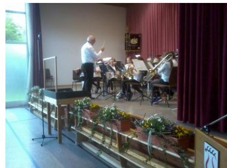
Auftritt beim Jugendkonzert im Juni

Am Donnerstag, 12.9.19, wird der AG-Brief für die Grundschule ausgeteilt. Unter anderem freuen wir uns darüber, dass wir wieder eine neue Bläserklassen-AG in Kooperation mit dem Musikverein Ochsenbach anbieten können. Die AGs starten in der Regel ab dem 23.9.19. Der Mittagstisch geht am 23.9.19 los. Den Speiseplan finden Sie bereits auf der HP. Der Nachmittagsunterricht beginnt für die WRS ab dem 16.9.19 (Bitte an Vesper denken!)